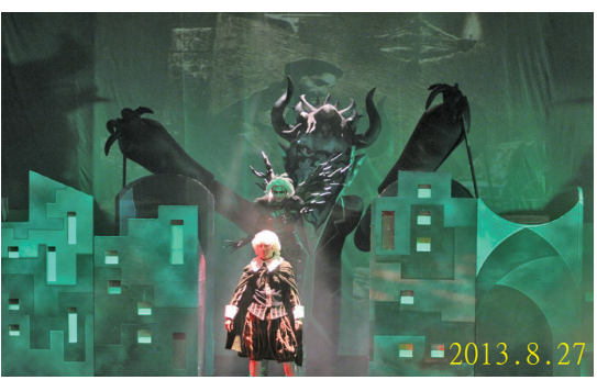
紙風車劇團「少年浮士德」反毒劇場