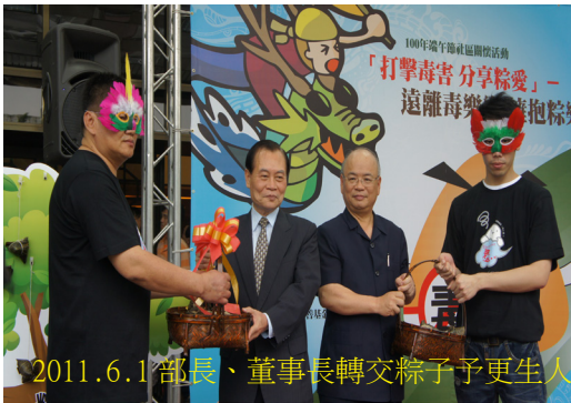
2011.6.1 部長、董事長轉交粽子予更生人