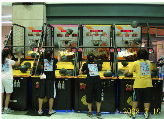
投籃藥不要反毒宣導