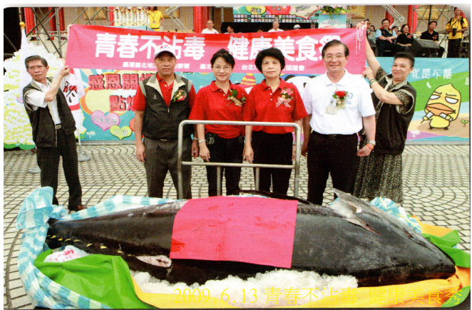
「2009年感恩關懷一點燃新希望青春不沾毒」美食健康祭宣導反毒活動