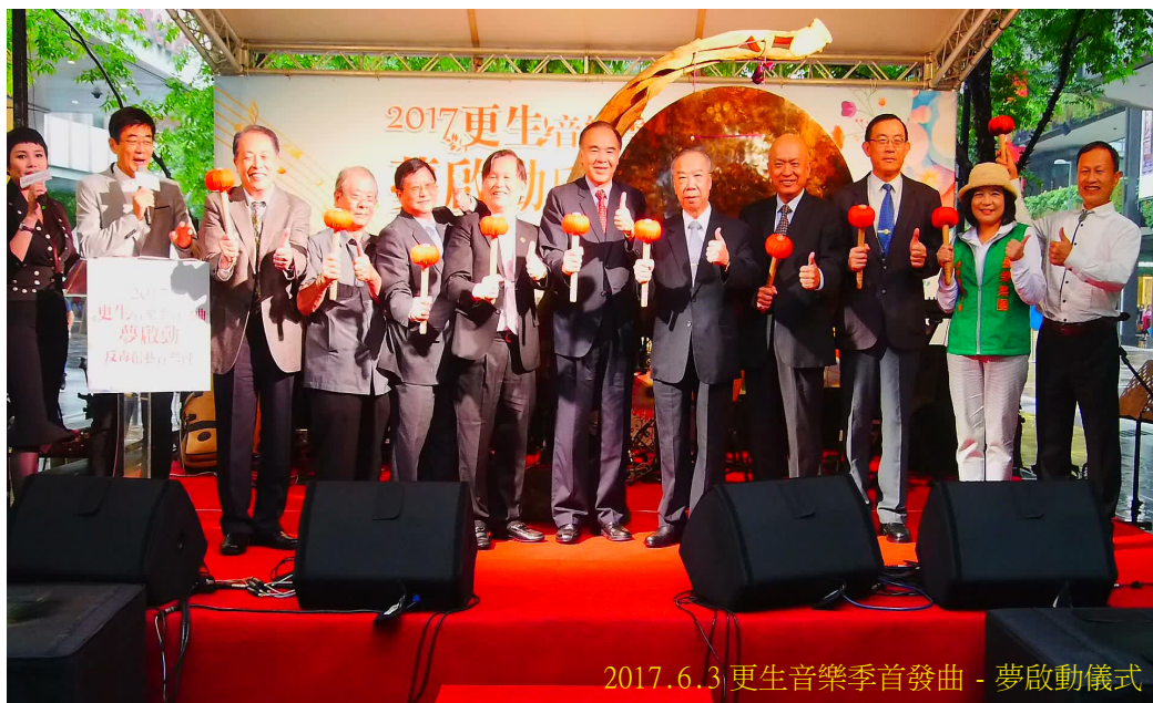
2017.6.3 更生音樂季首發曲 - 夢啟動儀式