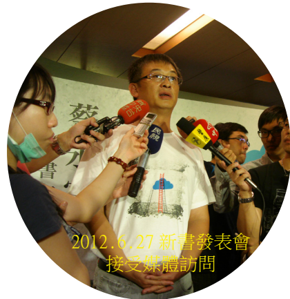
2012.6.27 新書發表會 接受媒體訪問