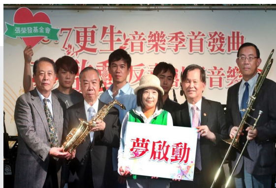
2017.6.3 張榮發基金會捐贈樂器