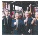
台北地檢署今日在法務部廣場舉辦端午節活動「打擊毒害，分享粽愛」...

http://www.cna.com.tw 2011-06-01 21:47:38