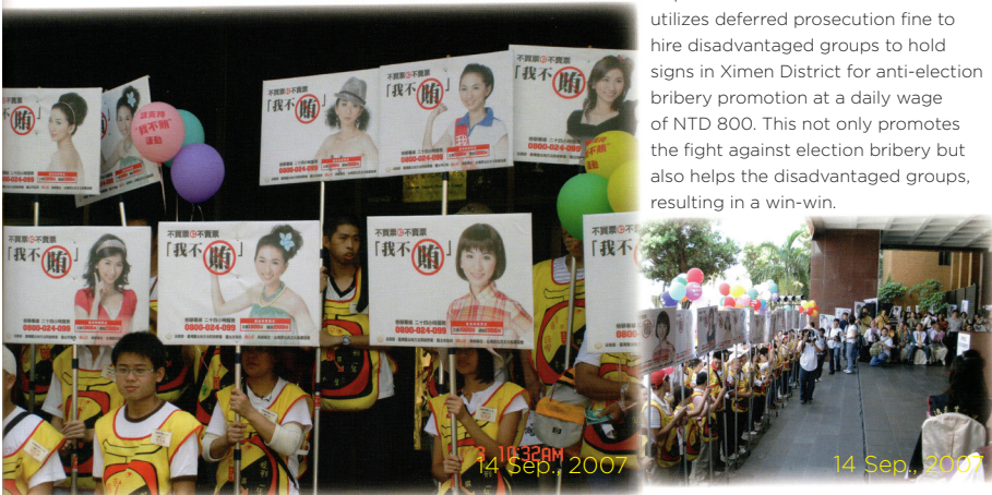
14 Sep., 2007

Taipei District Prosecutors Office utilizes deferred prosecution fine to hire disadvantaged groups to hold signs in Ximen District for anti-election bribery promotion at a daily wage of NTD 800. This not only promotes the fight against election bribery but also helps the disadvantaged groups, resulting in a win-win.