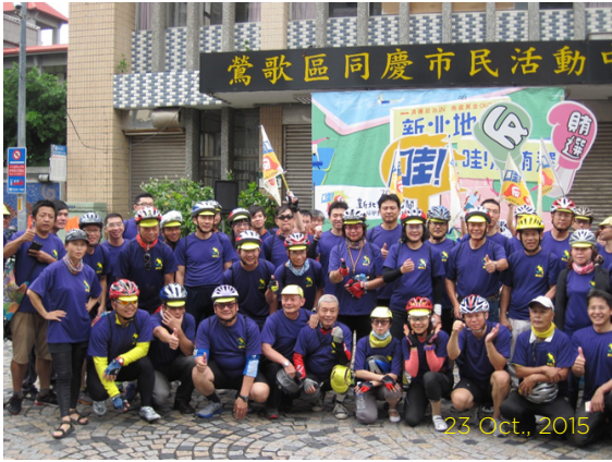
23 Oct., 2015