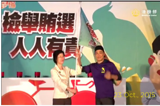
23 Oct., 2015