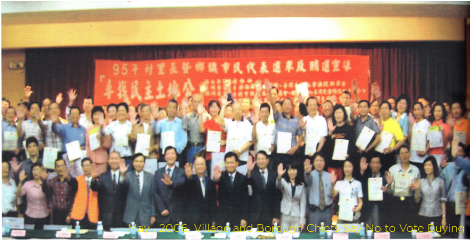
May, 2006, Village and Borough Chiefs Say No to Vote Buying