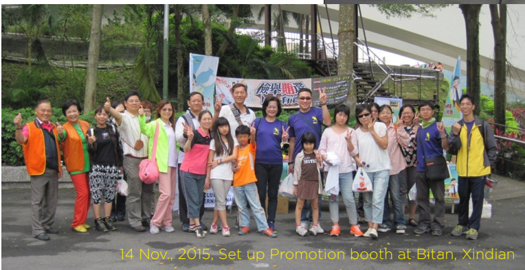
14 Nov., 2015, Set up Promotion booth at Bitan, Xindian