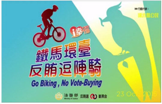
23 Oct., 2015