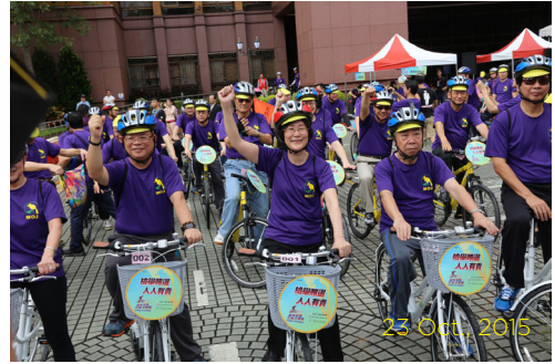
23 Oct., 2015