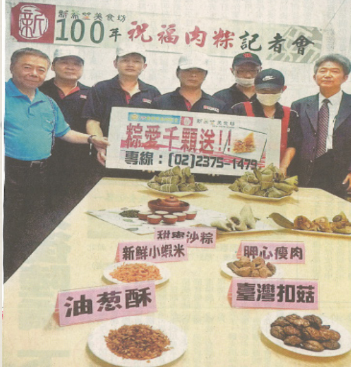
更生人保護協會採購兩千顆更生人所製作的愛心粽...