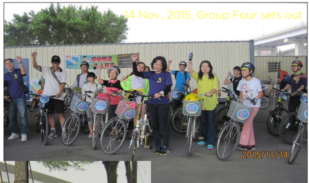
14 Nov., 2015, Group Four sets out