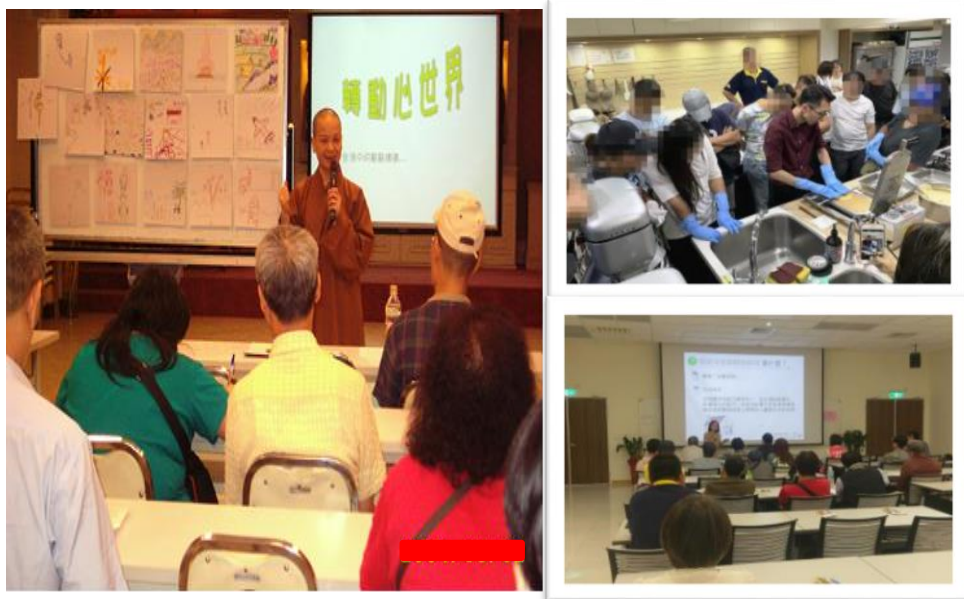
▲觀護人室辦理宗教輔導及就業轉銜債務更生課程

觀護工作除以觀護人室為主。並結合更生保護會、榮譽觀護人協進會、犯罪被害人保護協會，轄內公立的醫療、社工、教育、宗教慈善、志願工作等非營利社團建立既廣且深的司法保護團隊。