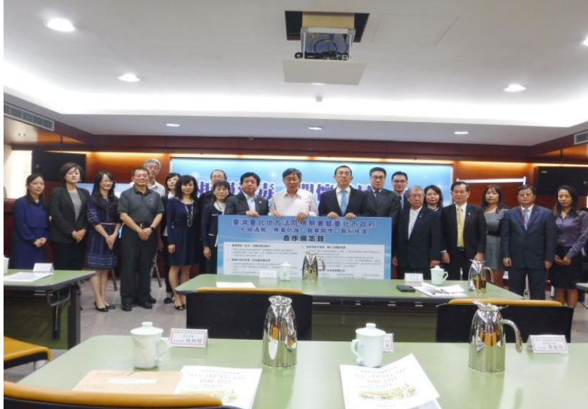
▲本署和聯合醫院松德院區辦理的緩起訴被告戒癮醫療處遇

觀護工作主要針對：加害人之犯罪防制被害人的保護，彌平其心靈創傷及對社會大眾進行法治宣導結合轄內的社工師、醫師、律師、檢察官、心理師及觀護人等不同領域的專業人士及團體進行不同處遇措施，以提升司法保護功能。