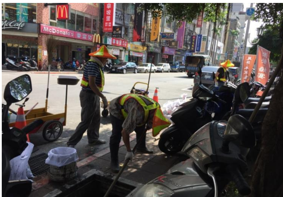
▲本署執行社會勞動處遇於本轄轄區進行公益關懷活動

觀護工作對象包括犯罪人、被害人、一般社會大眾及弱勢族群公益關懷及犯罪預防，因此觀護工作必須依據個別處遇原則解決個案的需求。對高危險的犯罪者除了複數監督機制外，尚有核心個案、加強管區警員報到，不定時的電話查訪及性侵害加害人的宵禁、電子監控等。另外針對不同個案進行團體輔導治療及救助轉介處遇措施。對社會大眾進行反毒、反賄選、青少年犯罪預防、家暴、兩性平權、法治觀念的宣導，也利用緩起訴處分金，社會勞動進行公益關懷及犯罪預防措施。