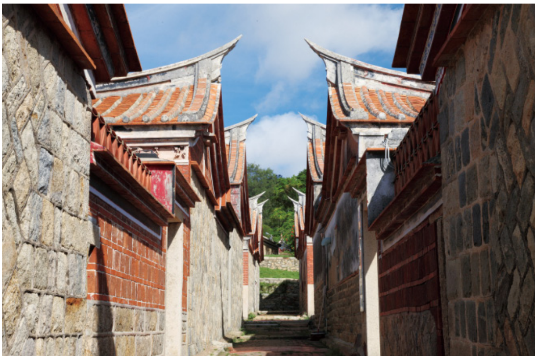
山后聚落燕尾巷 / 童清勝 / 金門縣文化局