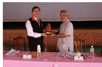
98.8.17 舉辦「98年度法務部暨所屬機關南區志工特殊訓練」，活動特別邀請第19屆金曲獎特別奉獻獎83歲國寶朱丁順老藝師，演出恆春民謠。