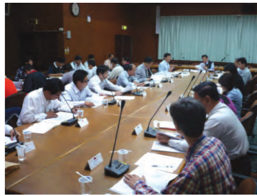
97.11.21 於本署四樓會議室召開「農漁會選舉賄選查察會議」。