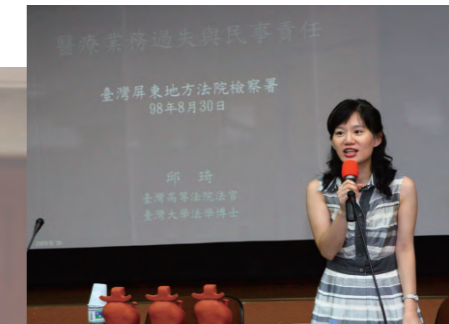
98.8.30 於本署四樓會議室舉辦「醫療業務過失法律與實務業務研討會」，計有屏東縣醫師公會及各公、私立醫院及診所醫師150餘人與會。