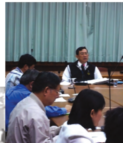
97.11.7 於本署四樓會議室召開「如何加強取締轄區河川盜濫採砂石」會議，召集了經濟部水利署第七河川局、屏東縣政府水利處、高屏流域管理委員會、屏東縣政府警察局國土保護暨油品查緝小組、各鄉鎮市公所等相關單位與會，宣誓取締盜採砂石之決心。