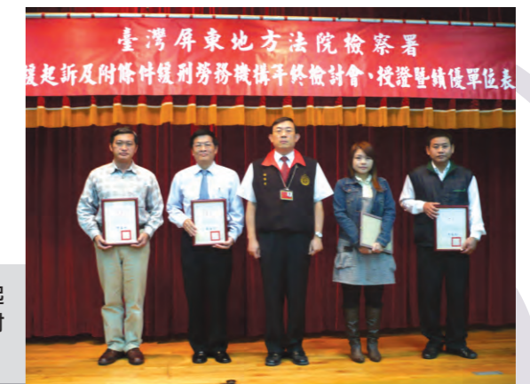
97. 12. 12 於本署四樓禮堂舉行「97年度緩起訴及附條件緩刑義務勞務執行機構年終檢討會、授證暨績優單位表揚典禮」。