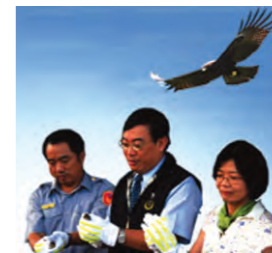
97.9.10 為解決每年恆春半島濫捕、濫殺候鳥，每年8月底或9月初，邀集相關單位及民間團體，由檢察長主持「恆春半島護野鳥、反獵鷹」專案會議，共同商討查緝及宣導保護過冬之候鳥。