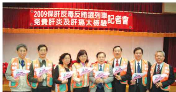
98. 1. 14 為關懷縣民並淨化98年農漁會屆次改選選風，特舉行『2009保肝反毒反賄選列車-肝炎篩檢及反賄選宣導活動』，並於本署四樓會議室召開「保肝反毒反賄選」記者會，並免費為縣民做肝炎篩檢。