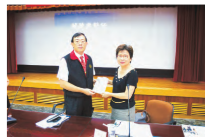
98. 7. 15 「98年度志工研習座談會議」。