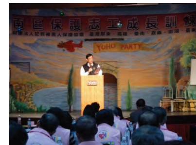
99. 4. 16 於墾丁悠活渡假村舉辦「南區保護志工成長訓練」。