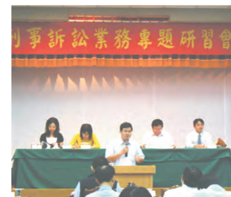
97.11.6 為增進本署檢察官及相關偵查輔助機關執法人員之偵查技巧暨強化院、檢間之溝通協調，特舉辦「刑事訴訟業務專題研習會」。