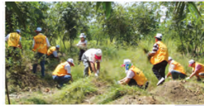
97. 9. 10 與屏東縣觀護志工協進會於屏東伯大尼之家舉辦「關懷憨兒 秋節感恩行」活動。