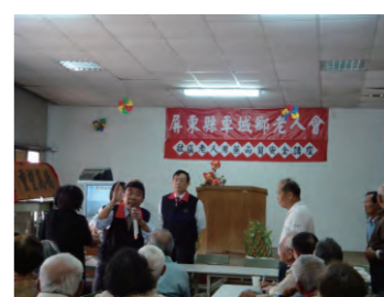
98. 4. 1 於車城鄉宣導「社會勞動」新制度。