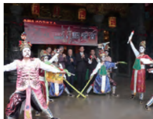
97. 12. 24 屏東慈鳳宮「2008阿猴媽祖杯全國青少年八家將官將首大賽」反毒反賄選活動。