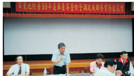
99.04.27 於本署四樓會議室舉辦99年選舉查察暨檢警調政風聯繫會議，共有檢警調及政風人員共180餘人與會。