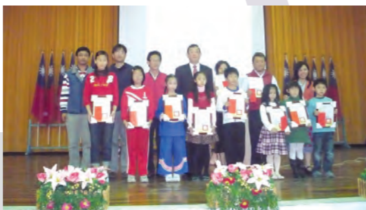
98. 1. 8 於屏東縣德協國小舉行「97年度全縣國小客、國語暨國中英語犯罪預防宣導演講比賽成果發表暨頒獎典禮」。