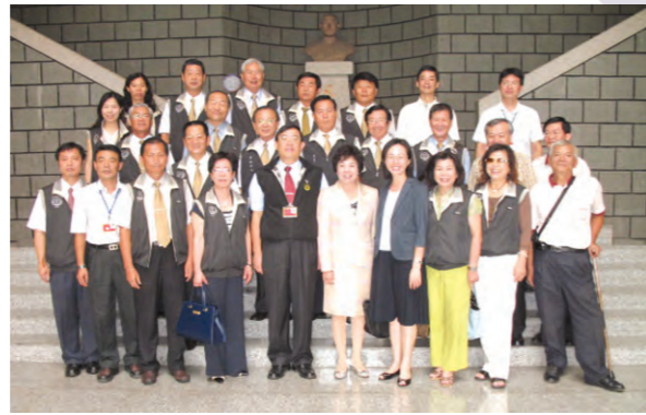
97. 9. 17 本署結合屏東縣原住民文教協會及屏東縣排灣族各教會，深入屏東縣原住民10個部落，涵蓋各原住民鄉鎮，舉辦「原住民法律服務宣導」。