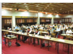
98.9.8 於台南舉辦「志工專業知能研習會議」。