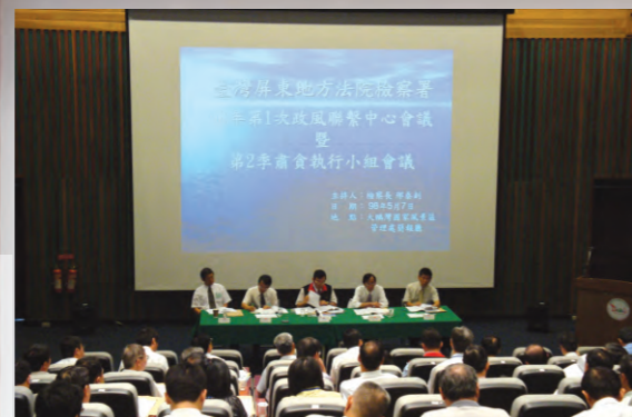
98.5.7 於屏東東港大鵬灣國家風景區會議室舉辦擴大政風會議，共有屏東縣政府政風處、屏東縣調查站及各鄉鎮政風人員共八十餘人與會。