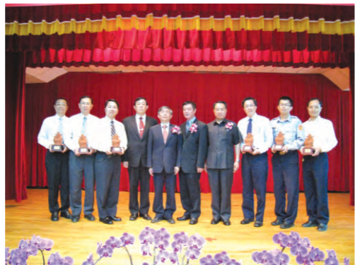
98. 2. 25 於本署四樓禮堂舉辦「更生保護會屏東分會第10屆委員會委員聘任典禮」暨「保護野生動物績優頒獎典禮」。