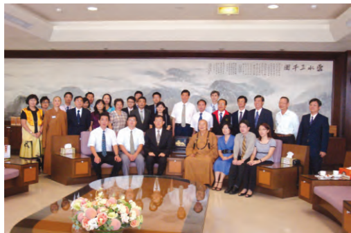
98.7.28 刑檢察長率領屏東地檢署三十餘位同仁至佛光山參加「心靈講座」，聆聽星雲大師演講。