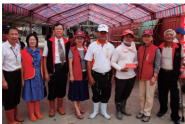
98. 9. 2 於佳冬、林邊視察社會勞動執行情形