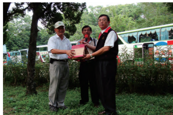
98.9.15 於本署四樓會議室舉辦「98年度屏東地區檢警聯席會議暨選舉查察業務專精講習」。