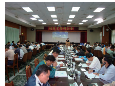
98.2.19 為增進警察相驗知識，特舉辦「相驗業務研討會」。