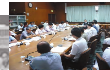
97.11.12 於本署四樓會議室召開「書記官會議」。