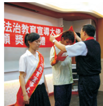
99.04 於屏東高工舉行「高中職法治教育宣導大使獎助學金頒獎典禮」。