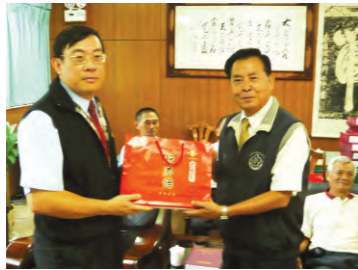
97. 9. 11 雲林觀護志工協進會來訪。