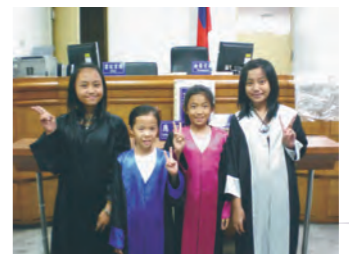
98. 7. 23 本署為落實「司法教育，從小做起」，特與地方各中小學合作，舉辦學生參訪地檢署活動。