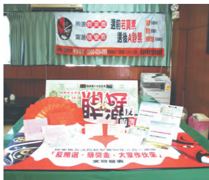
98. 11. 6 反賄選文宣記者會 於本署檢察長室召開反賄選文宣記者會，喊出「一機、一相、一袋、五百萬」之反賄選創意口號