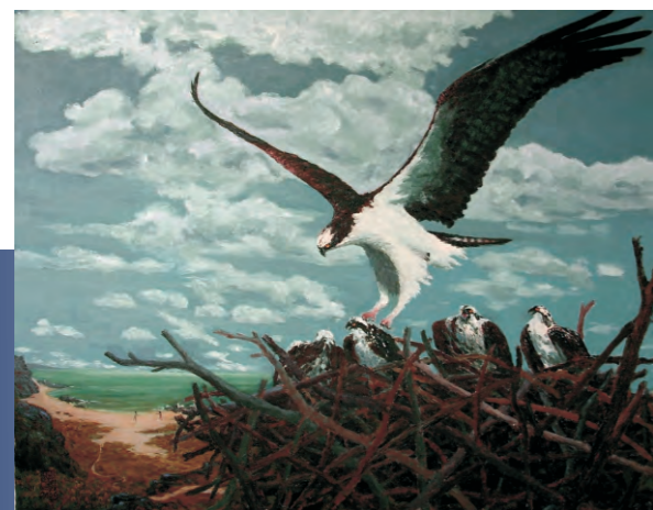
黎振華 回家 91x 72.5cm

魚鷹通常在河海之濱的上空盤翔，察覺魚蹤即俯衝抓捕，把魚獲帶到高處享用或帶回窩巢哺育幼鳥。 臺灣因地勢所限，河溪短淺，平日罕見有流水游魚的河川。據說有時魚鷹餓急了還會飛去魚塭冒險做賊。