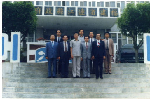
民國 77 年 7 月 1 日