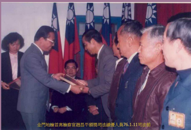
金門地檢首席檢察官趙昌平頒獎司法績優人員76.1.11司法節

不干涉司法獨立審判權，在院方來講就是司法審判獨立，在檢方來講是案件偵查部分都沒有受到軍方戰地政務影響，這是非常不容易的。換句話說，在那種戰地政務之下軍方還是尊重司法權這是非常重要的。我是民國 75 至 78 年在金門服務，我覺得那一段期間金馬的治安情況非常的良好，就是金門馬祖案件非常少，以金門來講，民國 81 年，因為李總統宣布終止動員戡亂（蔣經國總統是解除戒嚴，李總統是終止動員戡亂），當時行政院長郝柏村先生，特地到金門來進行了解因戰地政務中止而回歸到民主法治的前線地區，治安情況有何變化？尤其對居民之間會不會造成什麼困擾，或是居民之間對於法治治安方面能不能協調好，所以特地到金門地檢署來巡視，當時由我做簡報，我強調地區老百姓非常的純樸，也非常守法，我還很幽默的跟郝院長報告說：你坐飛機的時候，一定可以發現金門是個非常漂亮的戰地，在這個戰區裡，有很多又肥又大的黃牛，悠閒的在田野間吃草，但是報告院長金門絕對沒有一隻司法黃牛，從此可以發現我們這裡治安非常好，也不會有什麼關說，請院長放心，我們金門地區司法做得很好。不但這樣，我們與軍司法方面也會持續的互相支援協助。除了司法相互支