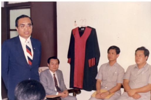
民國 77 年 7 月 1 日 連江司法大樓議價發包事宜

監察院受理人民陳情案件一個月大概一千六百件左右，這些案子的來源，監察院設有人民陳情中心，民眾可以來這裡陳情。其次監察委員地方巡察時接受人民的陳情，或者民眾也可以用書面寄來。對於人民陳情案件，如果這個案件在司法機關，在審判中或偵查中，或是在行政機關處理中的案件，我們不予處理，因為監察院的重點在事後的監督，是否依法行政。在受理陳情案件中，最多的是內政類案件，包括土地徵收、土地重劃、平均地權、土地重測這些土地問題，可能是台灣寸土寸金，所以這一方面的糾葛較多，大概佔有 28%；其次是司法類的，大概佔 22%，為什麼司法案件這麼多？是不是表示司法敗壞，也不能這樣說，因為不管民、刑事，以民事來講你不是敗訴就是勝訴，敗訴的人也會講司法不公，那刑事案件可能就是被告人家或被告，你沒有告成，也是認為檢察官不公，那這樣如果檢察官把你起訴，你又批評這個檢察官不公正，到司法審判也是一樣，因為本來民刑事案件，當事人是對立的，這是一個原因；另外民眾常誤解，