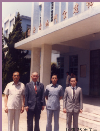
民國 75 年 7 月