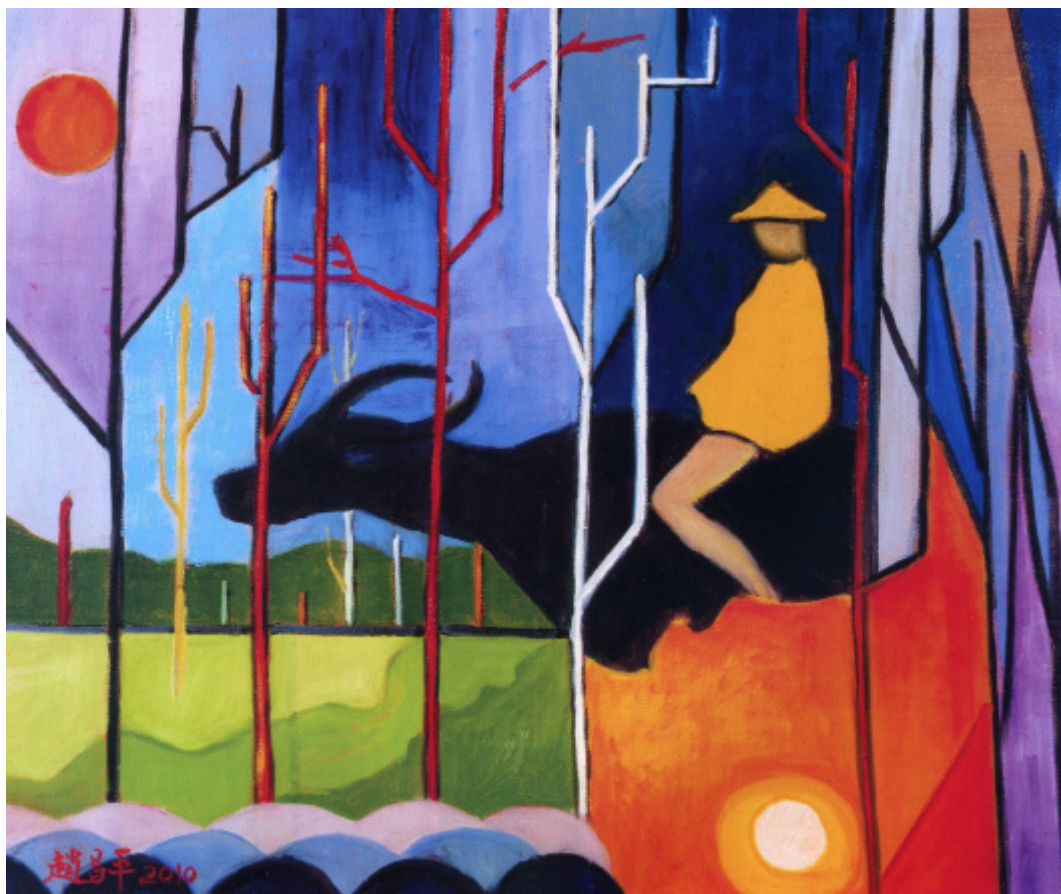
快樂的牧童 / 趙昌平